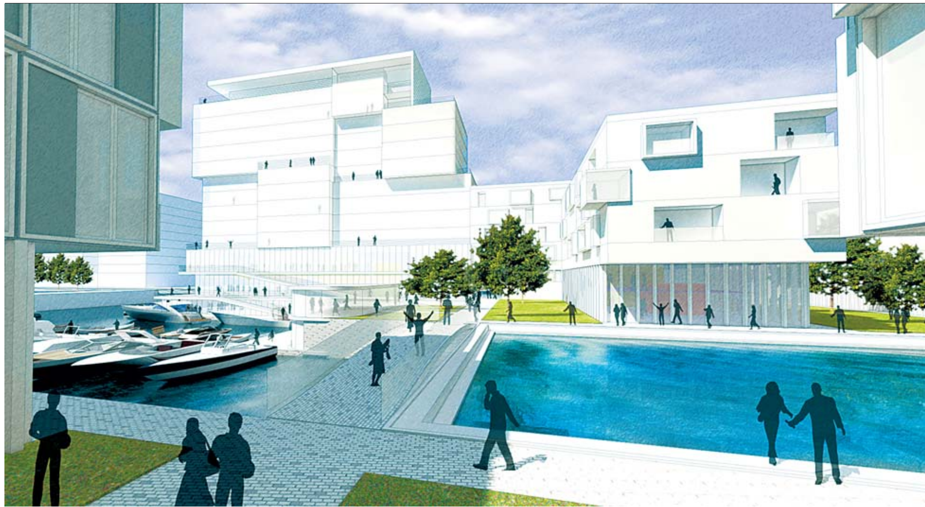
Im Harburger Binnengraben entsteht ein Stadtviertel mit Null-Energie-Gebäuden und ein City-Apartment-Haus mit neuem Wohnkonzept